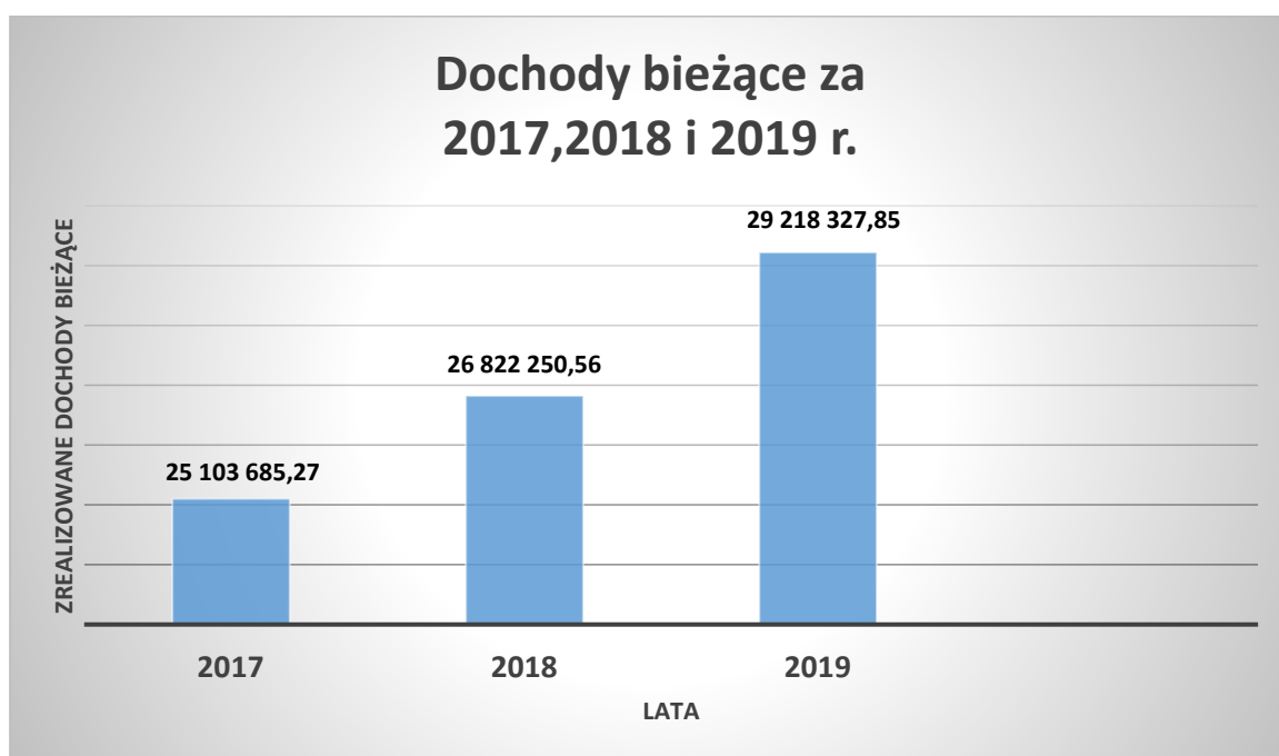
Wykres 1. Wykonanie dochodów Gminy Mieroszów za lata: 2017, 2018 i 2019

Porównanie wykonania dochodów bieżących i majątkowych za lata 2017, 2018 oraz 2019 rok przedstawiają poniższe wykresy.