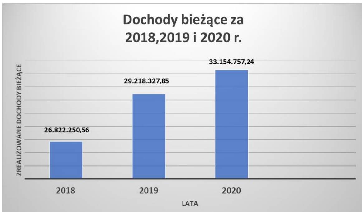
Wykres 1. Wykonanie dochodów bieżących Gminy Mieroszów za : 2018, 2019 i 2020

Porównanie wykonania dochodów bieżących i majątkowych za lata 2018, 2019 oraz 2020 rok przedstawiają poniższe wykresy.