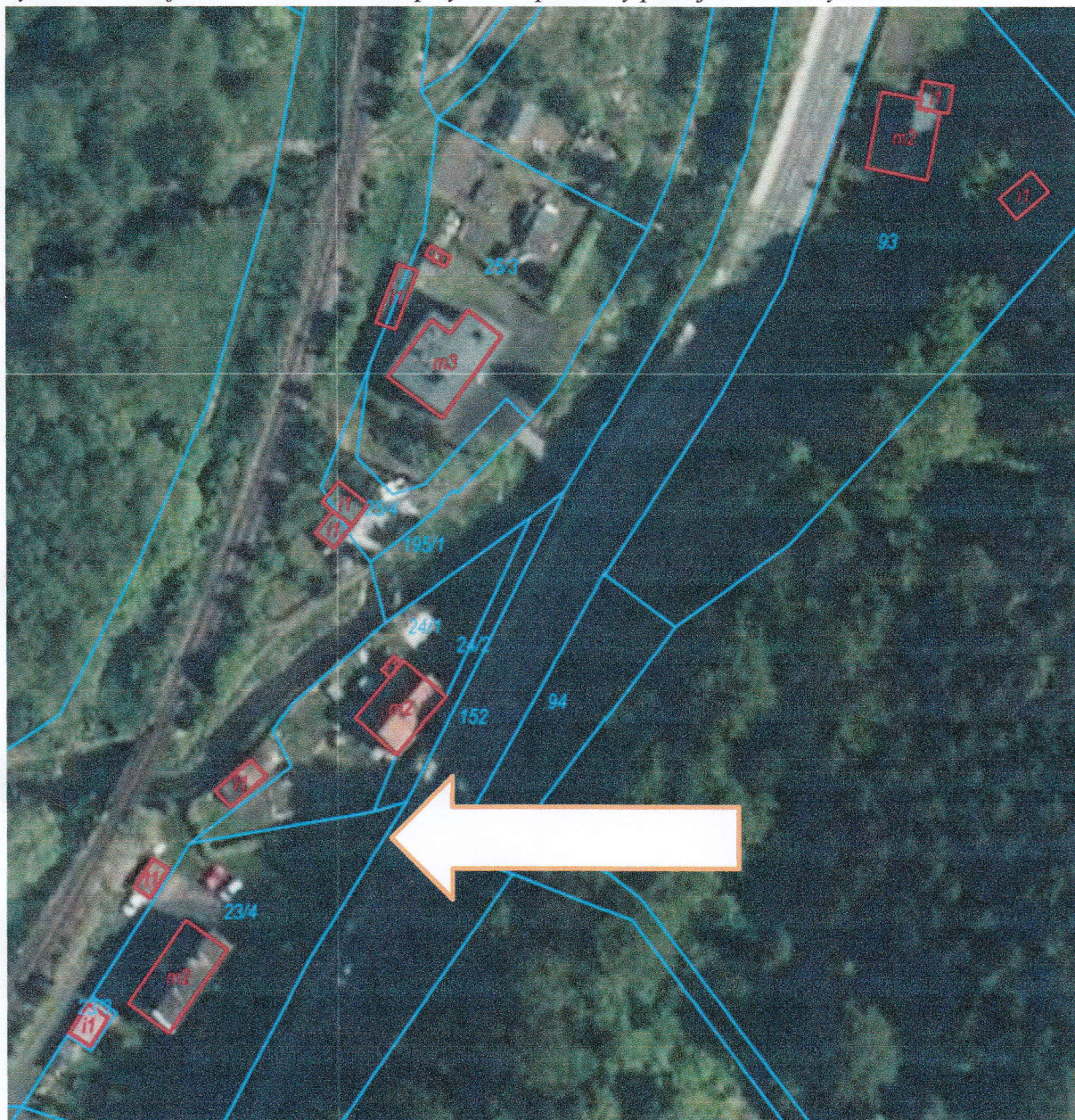
Rysunek : 2 miejsce – wzdłuż chodnika przy DK35 pomiędzy posesjami Wałbrzysak 37 i 39.